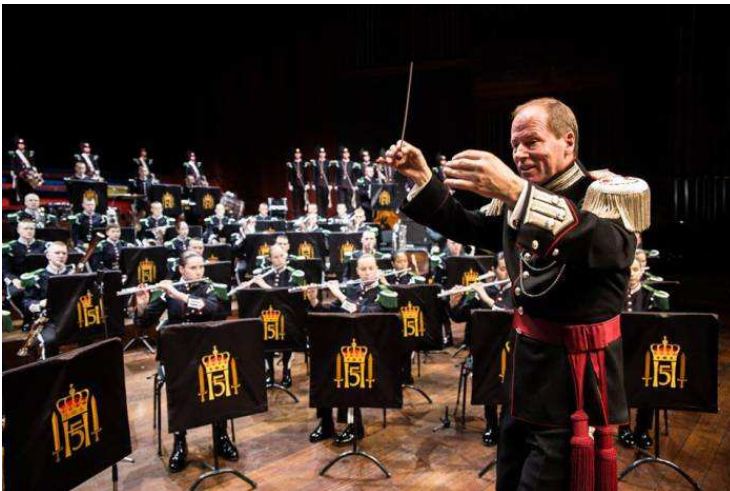
Fra Kolsås Rotary klubbs gardekonsert

Ut fra kostnadskalkylen må det deretter utarbeides en finansieringsplan som viser hvorledes prosjektet skal finansieres. Klubben vil nødvendigvis måtte skaffe en viss egenkapital, enten ved at man benytter klubbkassen, gjennomfører en kronerulle eller gjennomfører et inntektsbringende prosjekt, eksempelvis en konsert e.l.