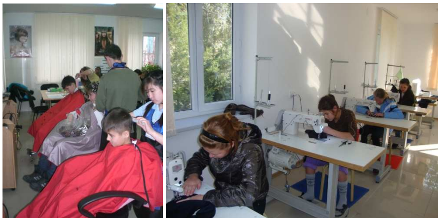
Fra Majorstuen og Oslo Rotaryklubbs yrkesskole prosjekt i Bishkek, Kirgistan

Når prosjektet er gjennomført er det viktig å gjennomgå resultatene for å sjekke at det oppsatte målet ble oppnådd eller eventuelt hvorfor det oppsto avvik. På bakgrunn av en slik gjennomgang er det viktig at det utarbeides en rapport. For TRF finansierte prosjekter (Global Grant og District Grant) er det krav til spesielle oppsett og formularer som skal fylles ut. For øvrige prosjekter er det ønskelig at Distriktets prosjekt rapporterings skjema benyttes og sendes til leder for Distriktets prosjekt komite for innlegging i prosjekt databasen under hjemmesiden. Dette for å vise bredden av klubbenes aktiviteter samtidig som databasen kan benyttes som idebank for andre klubber.