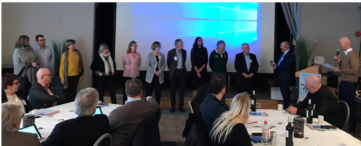
PETS og distriktstrening på Vettre hotell, 16. mars 2019