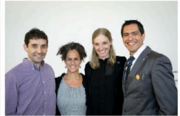
Endowment Fund Sikrer fremtiden