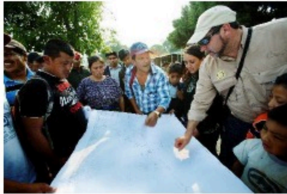
Annual Fund Brukes nå