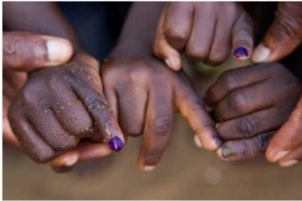
PolioPlus Fund End Polio Now