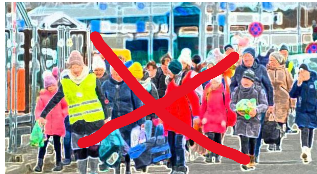
Flyktninger fra Ukraina ved grensa til Polen og byen Dorohusk. 1.8 millioner ukrainarar har flykta til nabolandet. Krigen har sendt 3 millionar på flukt, men det er usikkert kor mange som kjem til Norge.

Nettmøter med opptak. Spør alltid alle om det er OK å ta opp. Svarer en nei, kan du ikke ta opp.