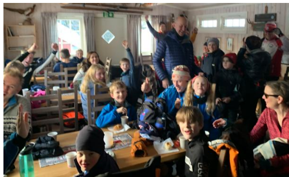
Spør om lov