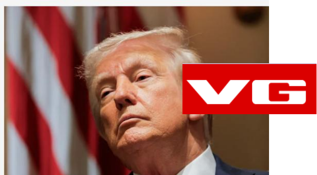
NEI uten tillatelse