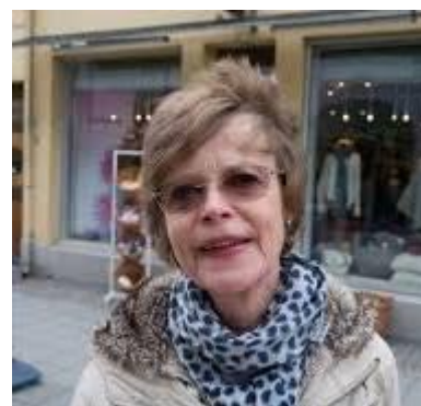
Burde ha spurt, men jeg blir nok tilgitt