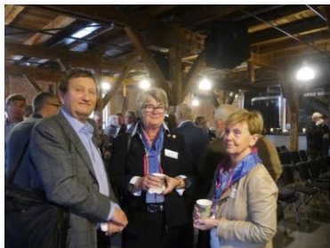
Medlemmer i distriktsrådet