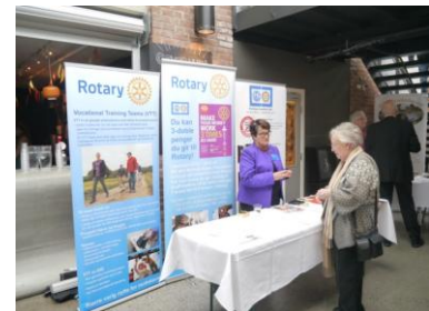
Info om End Polio Now