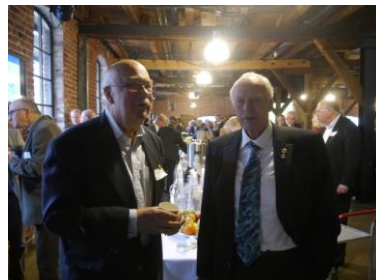
To flotte veteraner på DK