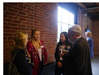
Utvexlingsstudenter med årets rotarianer