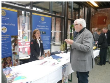
Informasjon om ungdomsutveksling