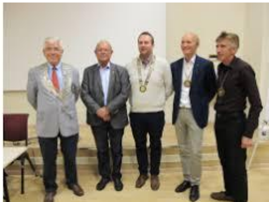
Fra intercitymøtet med alle presidentene og AG i region 7

Klubbene er flinke til å synliggjøre sitt arbeid, aktiviteter og Rotary gjennom disse lokale prosjektene, på sine hjemmesider og Facebook, samt medieomtaler i lokalpressen.